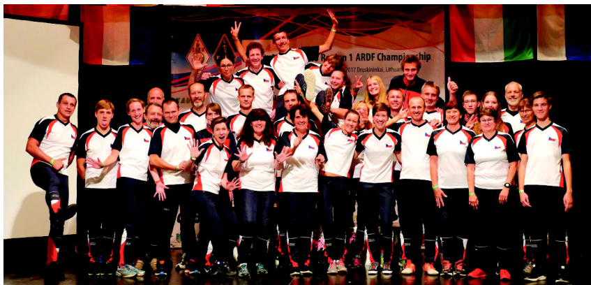
Obr. 1. Reprezentanti České republiky na ME 2017 v ROB v Litvě

ČR na 21. Mistrovství Evropy (IARU Reg. 1) v Litvě (4. až 10. 9. 2017) reprezentovalo 32 závodníků v 10 kategoriích. Šampionátu se zúčastnilo více než 300 sportovců z 25 zemí. Nejméně 1 medaili si odvázejí reprezentanti 16 států.