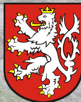
Závod se koná pod záštitou starostky Turnova